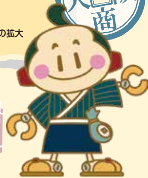
松阪商人サポート隊キャラクター 豪商あついきくん